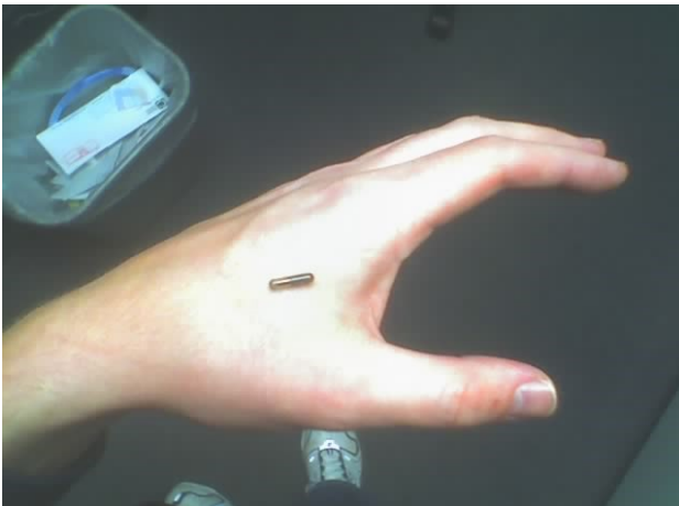
Abbildung 1 Quelle Wikipedia: http://commons.wikimedia.org/wiki/File:RFID_hand_1.jpg Lizenz: Creative Commons