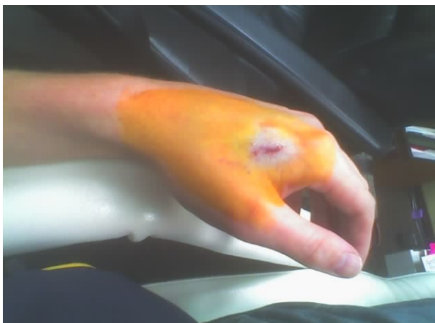
Abbildung 2 Quelle Wikipedia: http://commons.wikimedia.org/wiki/File:RFID_hand_2.jpg Lizenz: Creative Commons